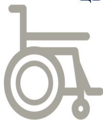
специальные технические средства