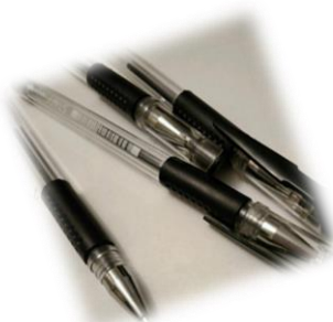
гелевую или капиллярную ручку с чернилами черного цвета