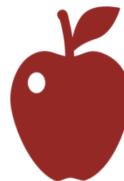
продукты питания, бутилированная питьевая вода (при условии, что их упаковка, а также их потребление не будут отвлекать других участников экзаменов от выполнения ими экзаменационной работы)