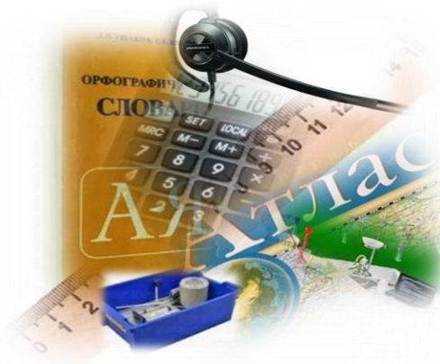
средства обучения и воспитания